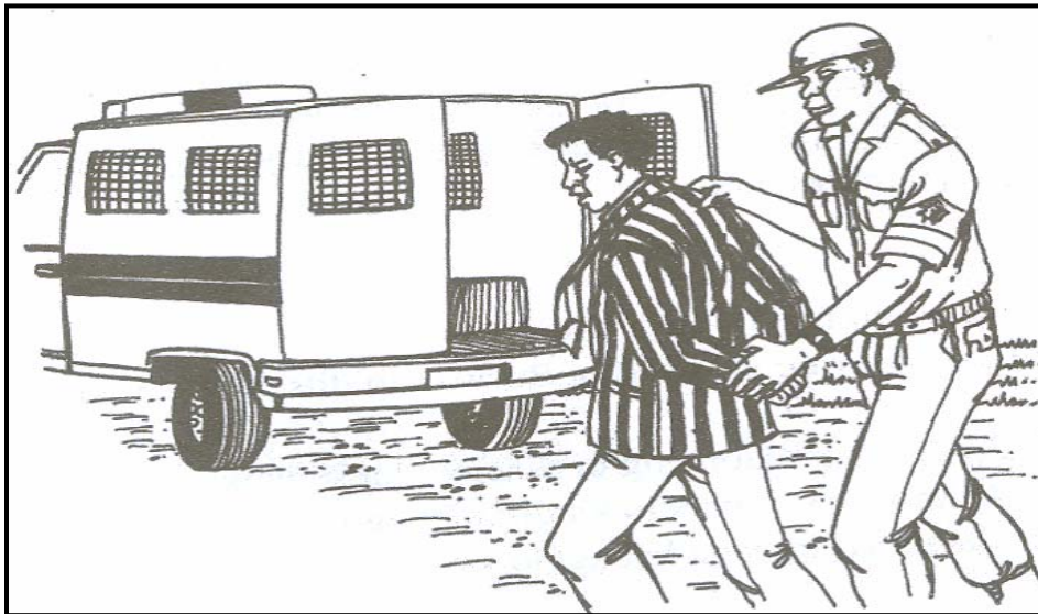
[Monate wa Setswana, DS Matjila le ba bangwe]