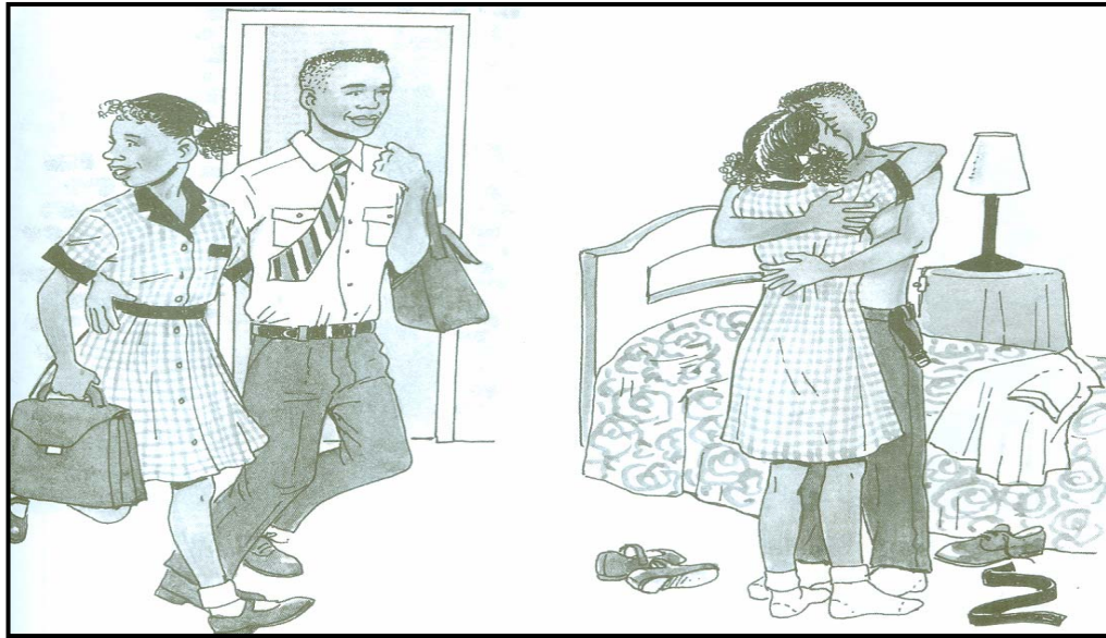
[Segarona, EE Pooe le ba bangwe]

1.8 Leba setshwantsho se se fa tlase, mme o kwale tlhamo ka ga sona.