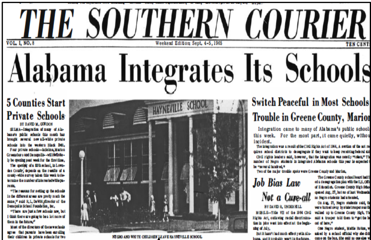
Neger- en wit kinders verlaat Hayneville Skool

Visuele Bron: Hierdie hoofskrif het op die voorblad van die The Southern Courier -koerant verskyn. Dit is op 4–5 September 1965 gepubliseer.