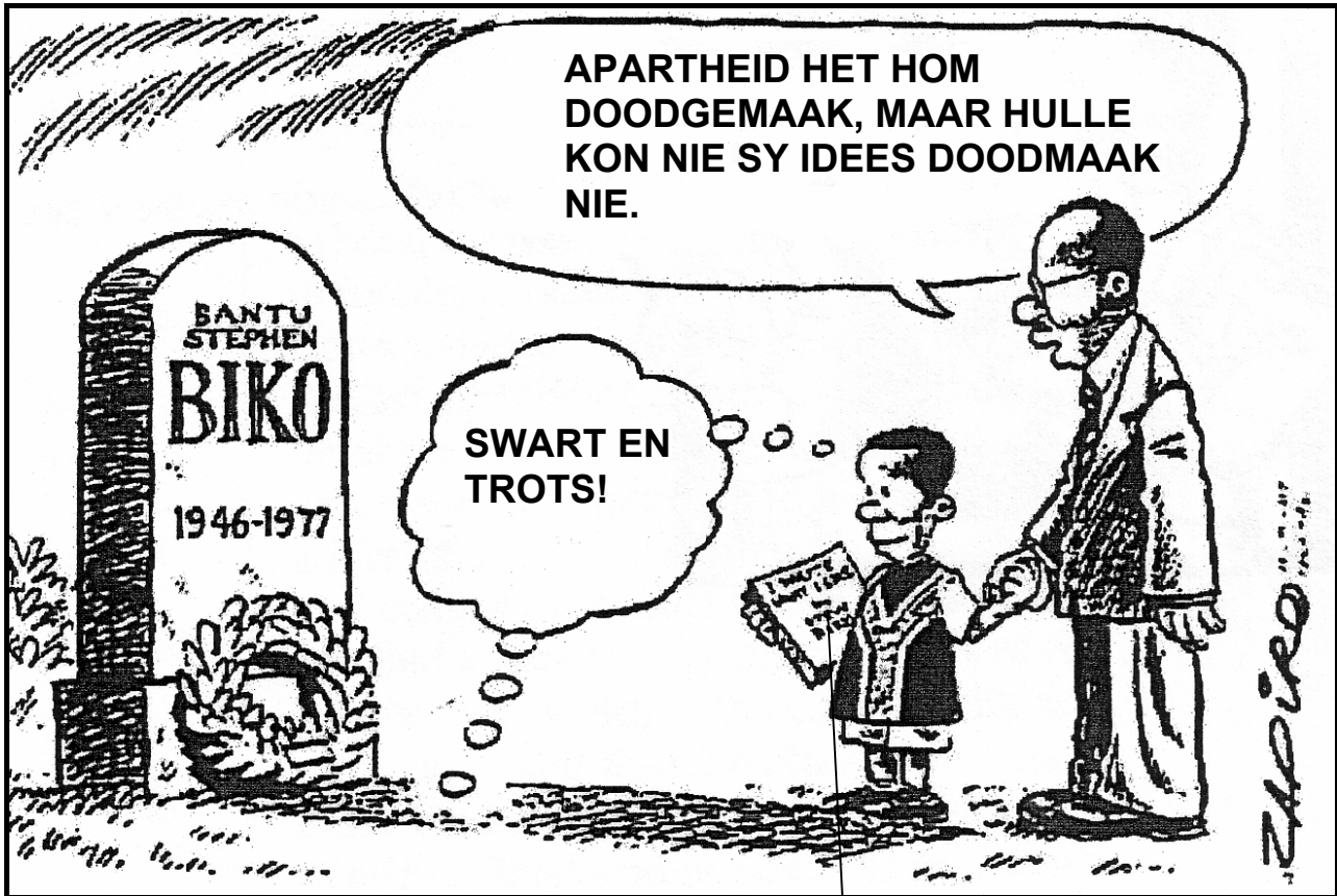
I Write What I Like deur Steve Biko

Die spotprent hieronder deur Zapiro, bring hulde aan Steve Biko, 1977.