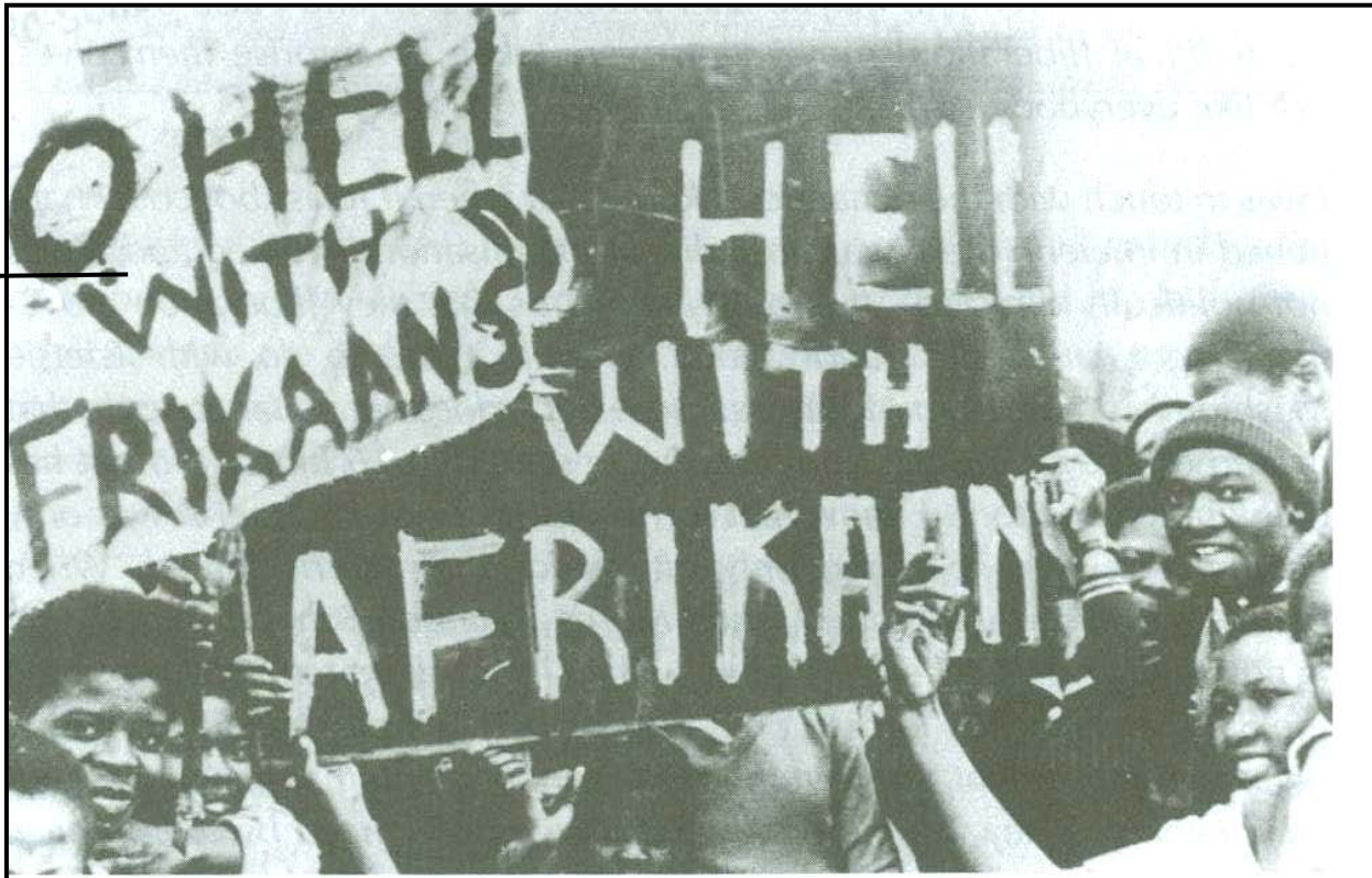
[Uit: The Soweto Uprising: Counter Memories of June 1976 deur SM Ndlovu]

Hierdie foto toon leerlinge van Soweto wat op 16 Junie 1976 teen die instelling van Afrikaans as 'n onderrigmedium protesteer.