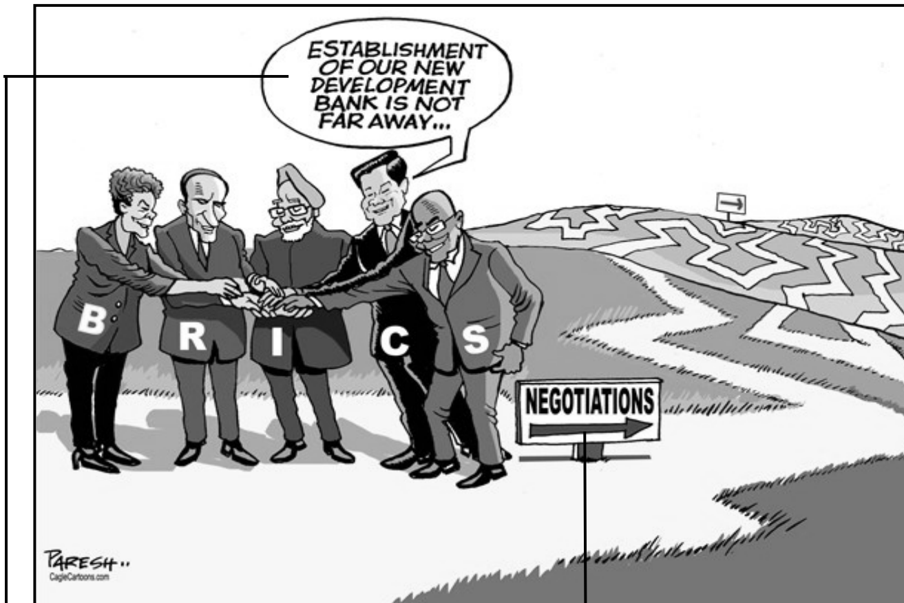
[Uit: www.cagle.com/2013/03/brics-development-bank . Toegang verkry op 20 Februarie 2015.]

Hierdie spotprent deur P Nath is op 28 Maart 2013 in die Khaleej Times (Verenigde Arabiese Emirate) gepubliseer. Dit beeld die BRICS-lede se voorneme uit om 'n Ontwikkelingsbank te stig.