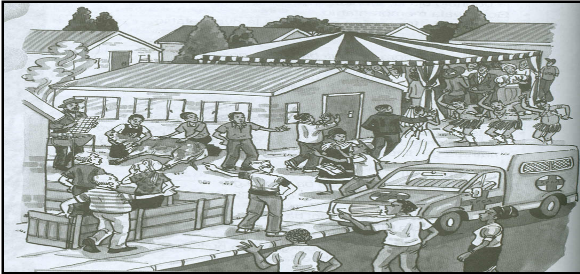
[Re Nwa A Mokgako: Shuter &amp; Shooter Publishers (Pty) Ltd]