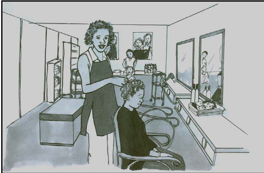
[Seipone, PC Mokotjo le ba bangwe]