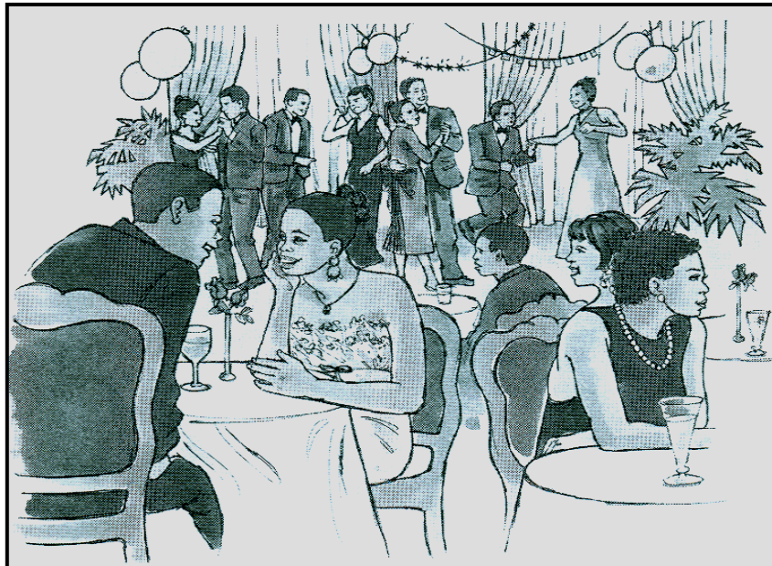
[Polelo ya ka, PM Kgatla le ba bangwe]

Lebelela setshwantsho se se latelang, mme morago o thale karata ya taletso.