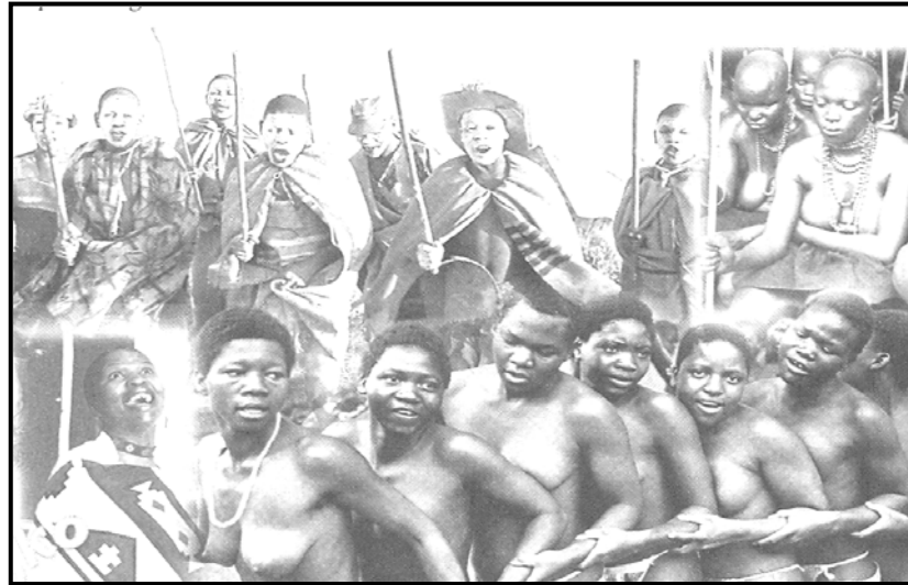
[Setswana Tota, Serobatse ME le ba bangwe]