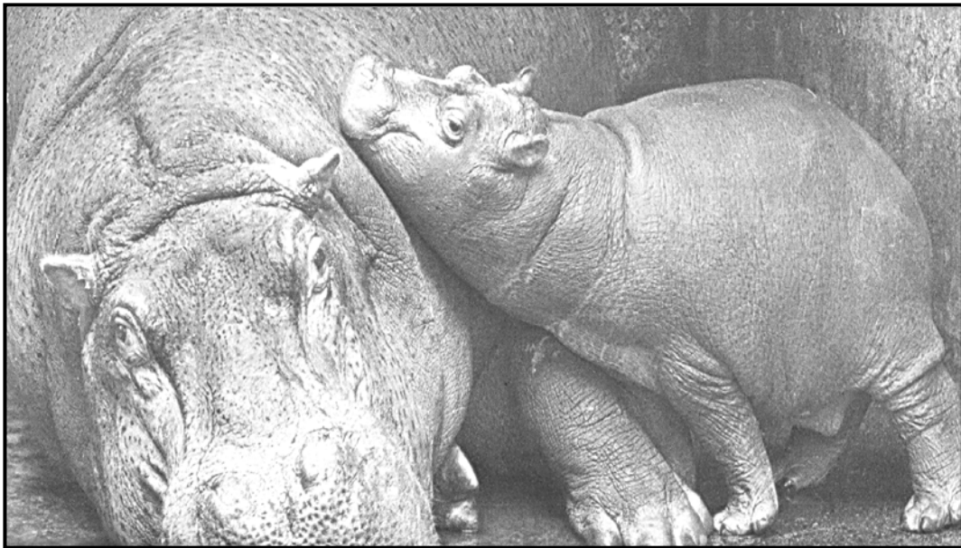
[Lokwalodikgang Iwa The Times , 25 Ngwanaitseele 2011]