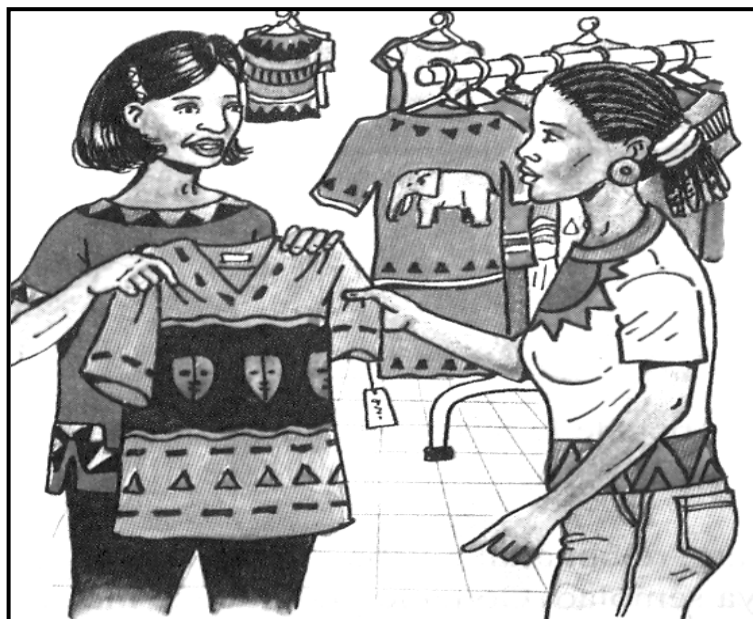
[Monate wa Setswana, Matjila DS le ba bangwe]

1.7 Leba setshwantsho se se fa tlase, mme o kwale tlhamo ka ga sona.