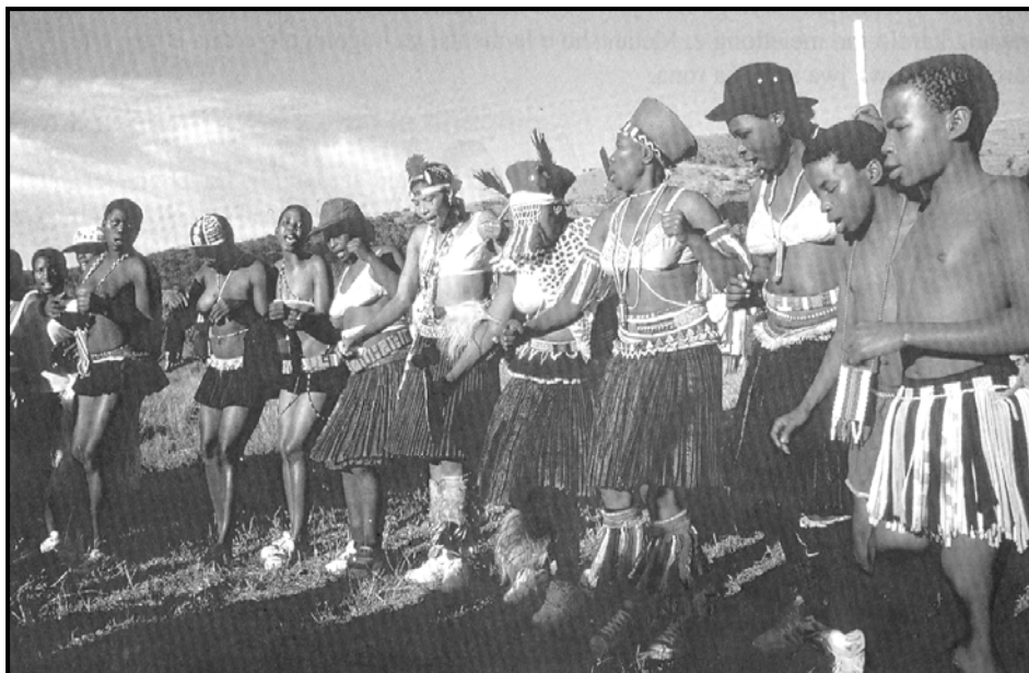
[Monate wa Setswana, Matjila DS le ba bangwe]