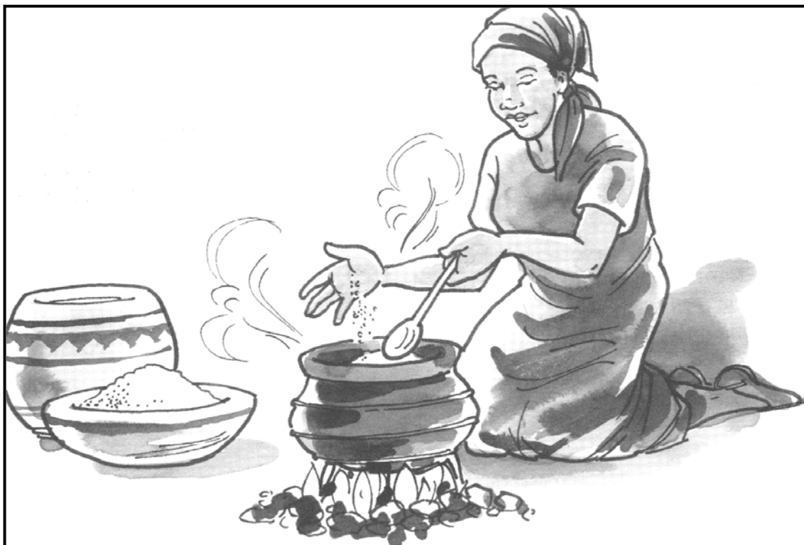
[Polelo ke lehumo, M Maja le ba bangwe]