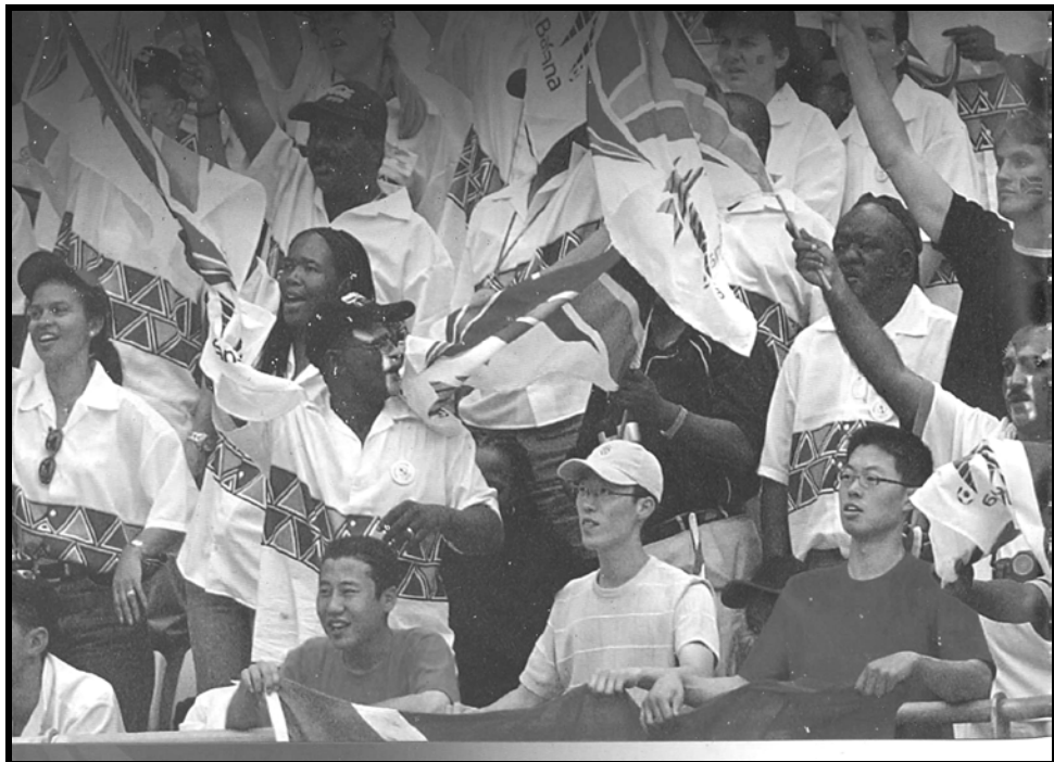
[2010 FIFA World CUP South Africa]