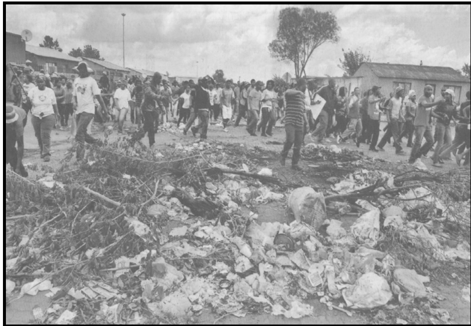
[The Star: 24 Diphlane 2013]