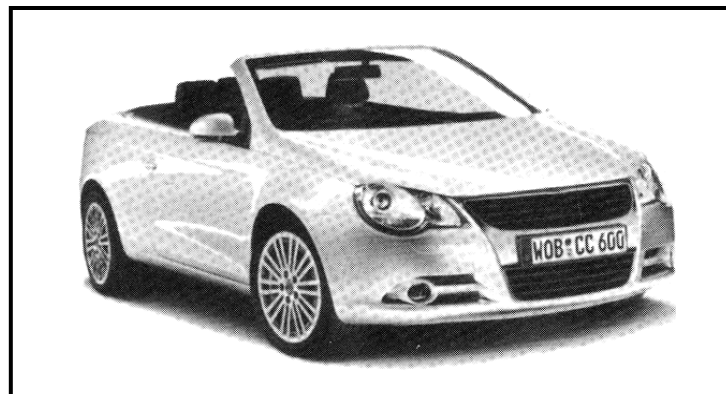
[Segarona, BN Kgosisikoma le ba bangwe]

Sekaseka setshwantsho se se fa tlase, mme morago o thale papatso e mo go yona o ngokang kgathhegelo ya bareki go reka sejanaga sa gago.