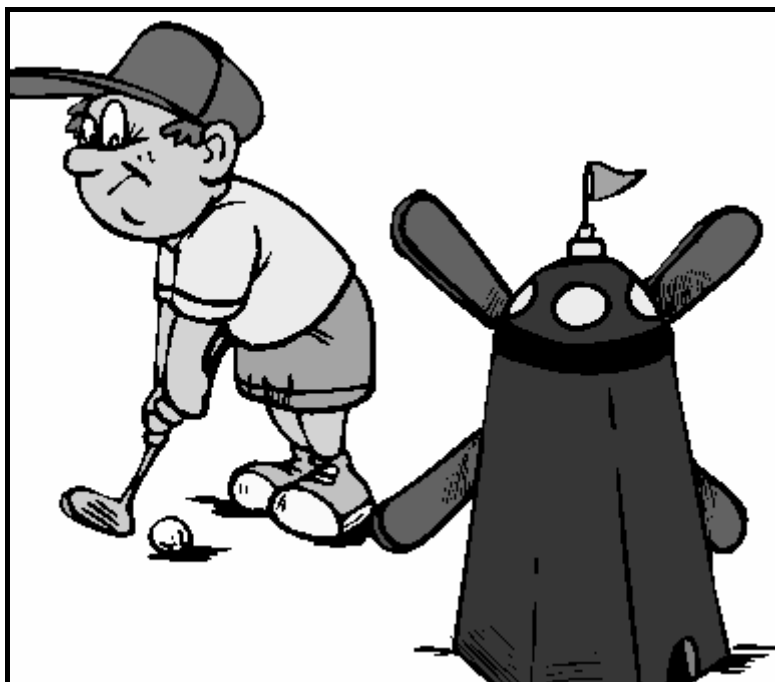
[Art explosion 300,000 (Premium Image Collection)]