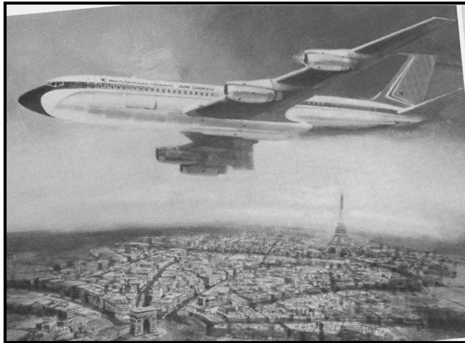
[Xifaniso lexi xi huma eka magazini ya Sowetan Soccer Issue 24 ]