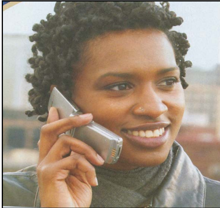
[Move, Mei 2012]