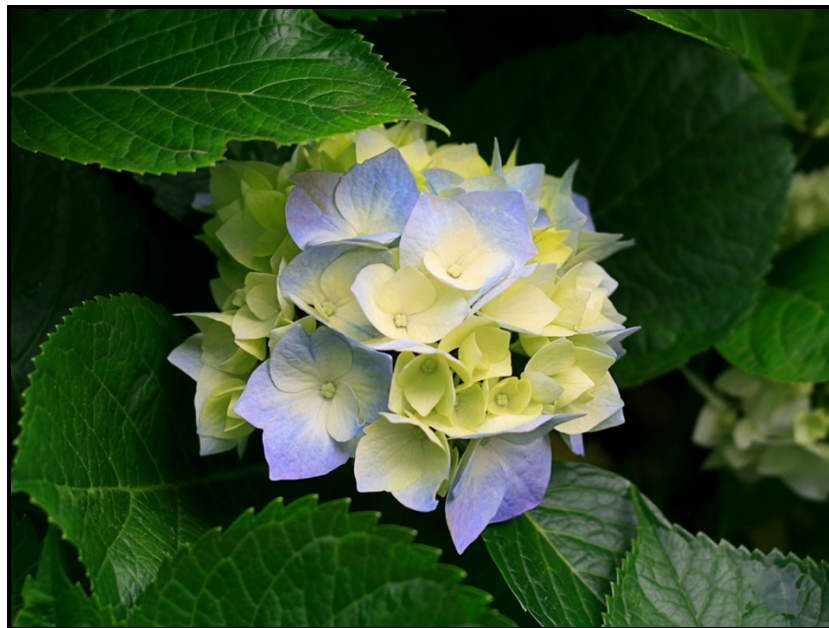
[Xi huma eka: Sample pictures]