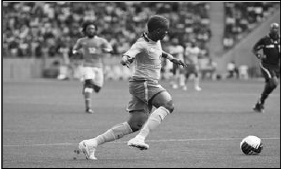
[Xifaniso lexi xi huma eka www.google.com ]