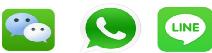
Figuur 2: Kitsboodskaptoepassings

Kitsboodskappe het egter ook sekere nadele. Aangesien die verwagting bestaan dat die ontvanger die boodskap onmiddellik sal lees en daarop reageer, kan dit produktiwiteit belemmer of op waardevolle gesinstyd inbreuk maak. Ouers word dikwels met boodskappe van die skool en verskillende kletsgroepe gebombardeer sodat hulle oorweldig mag voel. Soms neem die sender van 'n boodskap nie in ag hoe laat dit is wanneer hulle die boodskap stuur nie. Dit kan sekere sekuriteitimplikasies hê en stelsels en privaatheid in gevaar stel. Die gebruik van kitsboodskappe het ook wetlike implikasies wat dikwels swak verstaan word.