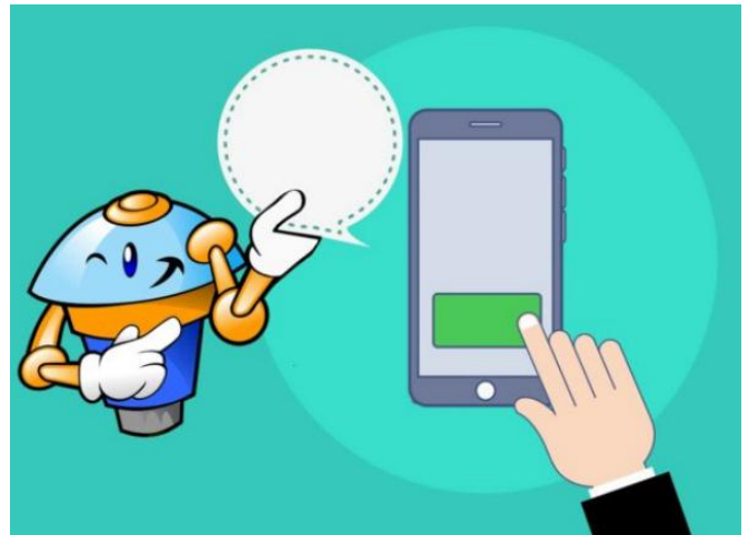
Figuur 1 : Potensiële gebruike van chatbots en kitsboodskaptoepassings vir onderrig en leer - Emerging Education Technologies (emergingedtech.com)

Mense gebruik kitsboodskappe nie slegs om in kontak te bly nie, maar dit het ook 'n belangrike besigheidsinstrument geword en word algemeen in akademiese situasies gebruik. Ons gebruik dit ook om ons daaglikse lewens en verantwoordelikhede te organiseer! Kitsboodskappe laat ons nie net toe om maklik te kommunikeer nie, maar hou ons ook op hoogte van kommunikasie.